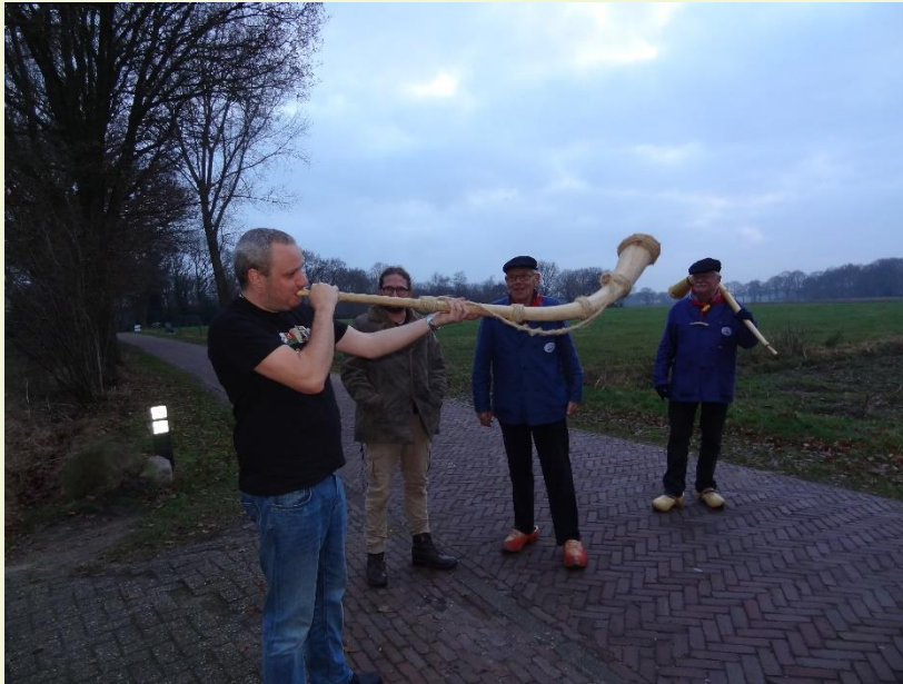
Onverwachte gasten en gezamenlijk hoornblazen, Midwinter 2017

Wijzelf blazen de hoorn, joelen wat af, en wie weet worden we wel bezocht door figuren als hierboven. Wij kennen ze als Perchten. Elk jaar is het weer een verrassing wie er op bezoek komt, en met hoeveel. Deze figuren kenmerken zich door zwartgemaakte of onherkenbare gezichten, als verbeelding van het dodenleger van Wodan.