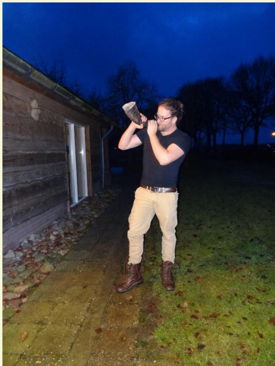
Hoornblazen (Midwinter 2017 n.o.j.)