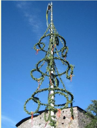
Midzomerstaak, Finland (stockfoto).

Op de volgende pagina's vinden we een beschrijving van hoe een weekeinde eruitziet waarin Heidevlam Midzomer viert.