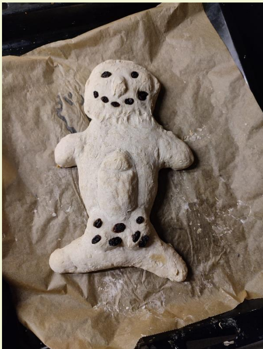
Baldrfiguur in brood uitgevoerd. Let op het detail van de fallus, welk symbool staat voor vruchtbaarheid.

Nadat iemand Balder heeft getroffen, wordt hij op een offerschaal gelegd. De aanwezigen zullen een offer naast het broden lichaam leggen. Hiermee symboliseren we de grafrituelen van Balder. Onder het uiten van rouw wordt hij op de brandstapel gelegd, in afwachting van het avondritueel.