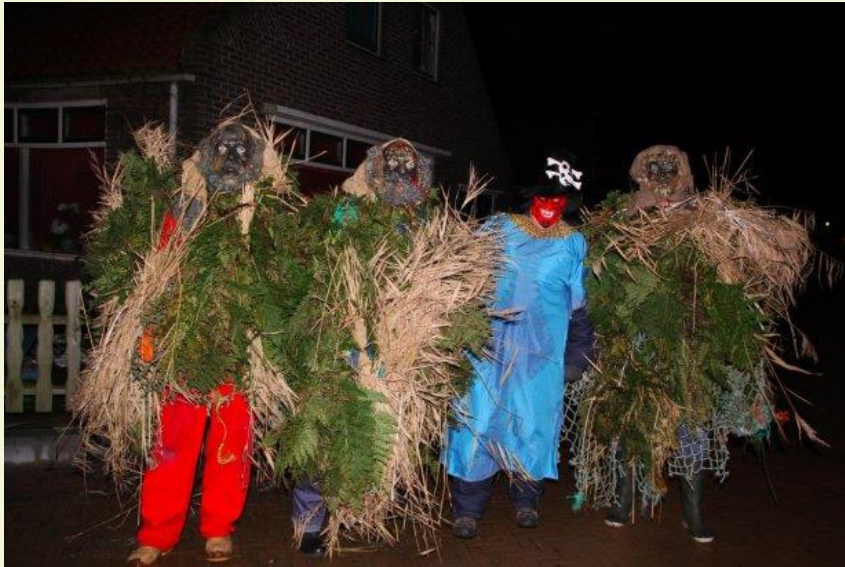
Sunneklaas, Ameland (3)