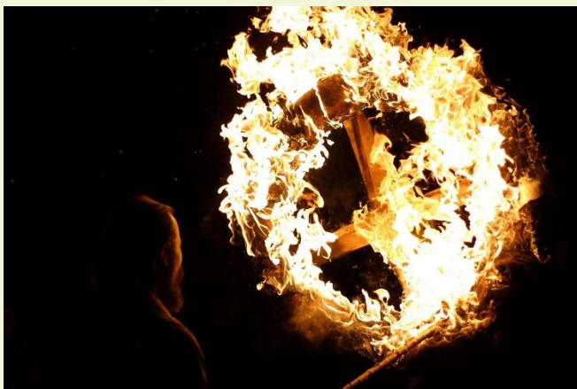
Het Joelrad in vlam

De vuurmeester of aangewezen persoon brengt het wiel in beweging met de brandende fakkel. Deze wordt langzamerhand, maar steeds sneller, bewogen tot er een vurig wiel ontstaat.