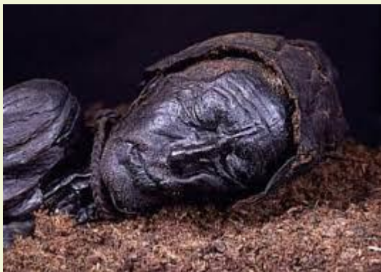
Tollund man, Denemarken.

We herkennen hier een zekere pietermanknecht in. Deze moderne variant, al dan niet met vegen of andere politiek-correcte vorm, is direct herleidbaar als verbeelding van de doden. Immers, die worden zwart na de dood. En niet alleen veenlijken als de Deense Tollund man, elke dode zal ergens die kleur aannemen. Huidskleur van de levenden doet niet eens mee in dit verhaal – wellicht ten overvloede, maar niet onbelangrijk gezien er veel verkeerde aannames zijn en worden gemaakt.