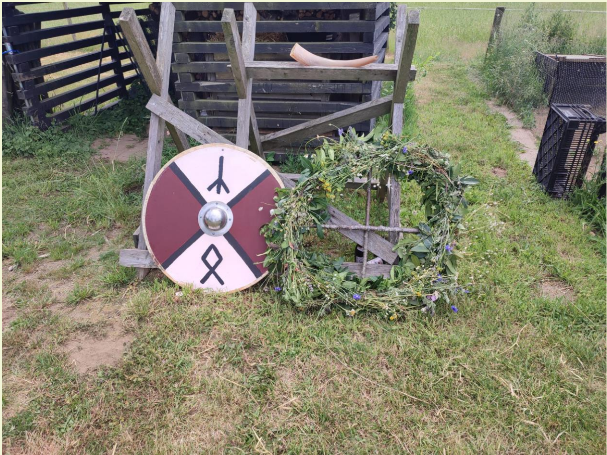
Het gemaakte Joelrad. Dit rad wordt gedroogd en met Midwinter in brand gestoken, om de zon weer in beweging te krijgen (Foto Midzomer 2023).

Er wordt in de vroege morgen ontbeten en daarna gaan we op pad. Samen met elkaar zoeken we langs de velden en wegen naar midzomerbloemen en groen dragende jonge twijgen, welke we gaan gebruiken in ons Joelrad. Dit rad wordt gedroogd en opgeborgen tot aan Midwinter.