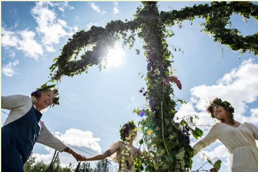
Midzomer, Zweden.

In Nederland vieren vooral de Germaans-heidense groepen dit feest. Het is geen uitbundig gevierd algemeen feest zoals dit bijvoorbeeld nog wel het geval is in de Scandinavische landen of de bergen van Oostenrijk en Duitsland. Daar leeft dit feest nog voort, in een meer of meer oorspronkelijke vorm. Er wordt rond de meiboom gedanst, er zijn grote vuren en allerhande vruchtbaarheidsriten.